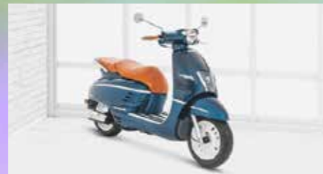
DJANGO 125 ABS ab 3599,- €

Verbrauch: 1,9 l/100 km, CO 2 -Emission: 45 g/km, Norm: Euro 5