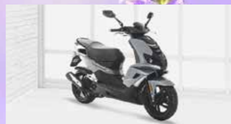
SPEEDFIGHT 50 ab 2949,- €

Verbrauch: 2,4 l/100 km, CO 2 -Emission: 52 g/km, Norm: Euro 5