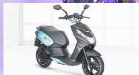
ESTREETZONE ab 3099,- €

Verbrauch: N/A, CO 2 -Emission: 53 g/km, Norm: Euro 5