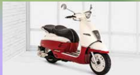
Django 50 classic ab 3049,- €

Verbrauch: 1,75 l/100 km, CO 2 -Emission: 41 g/km, Norm: Euro 5