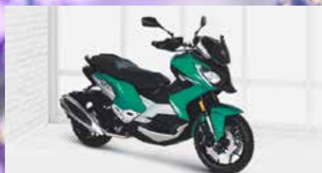
XP 400 ALLURE ab 7599,- €

Verbrauch: 2,5 l/100 km, CO 2 -Emission: 58 g/km, Norm: Euro 5