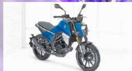
PM01-125 ab 4199,- €

Verbrauch: 2,4 l/100 km, CO 2 -Emission: 53 g/km, Norm: Euro 5