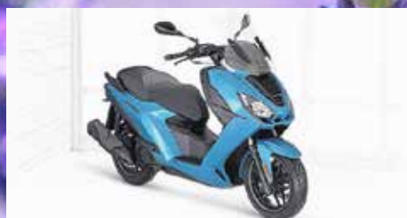
PULSION 125 active ab 4899,- €

Verbrauch: 3,8 l/100km, CO 2 -Emission: 88 g/km, Norm: Euro 5