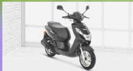
KISBEE 50 4T ACTIVE ab 2199,- €

Verbrauch: 1,75 l/100 km, CO 2 -Emission: 41 g/km, Norm: Euro 5