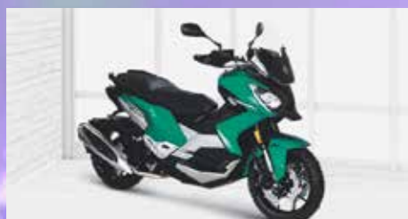
XP 400 ALLURE ab 7599,- €

Verbrauch: 2,3 l/100km, CO 2 -Emission: 52 g/km, Norm: Euro 5