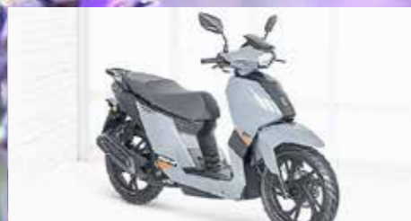
TWEET GT 50 ab 2799,- €

Verbrauch: 3,8 l/100km, CO 2 -Emission: 88 g/km, Norm: Euro 5